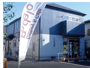
ファーストステップの外観

ファーストステップは、障がいをお持ちの方も、環境やサポートの工夫で「やりがい」「いきがい」が見出せる施設を目指して、常にチャレンジする気持ちを大切にしながら活動を続けていきたいと思っています。